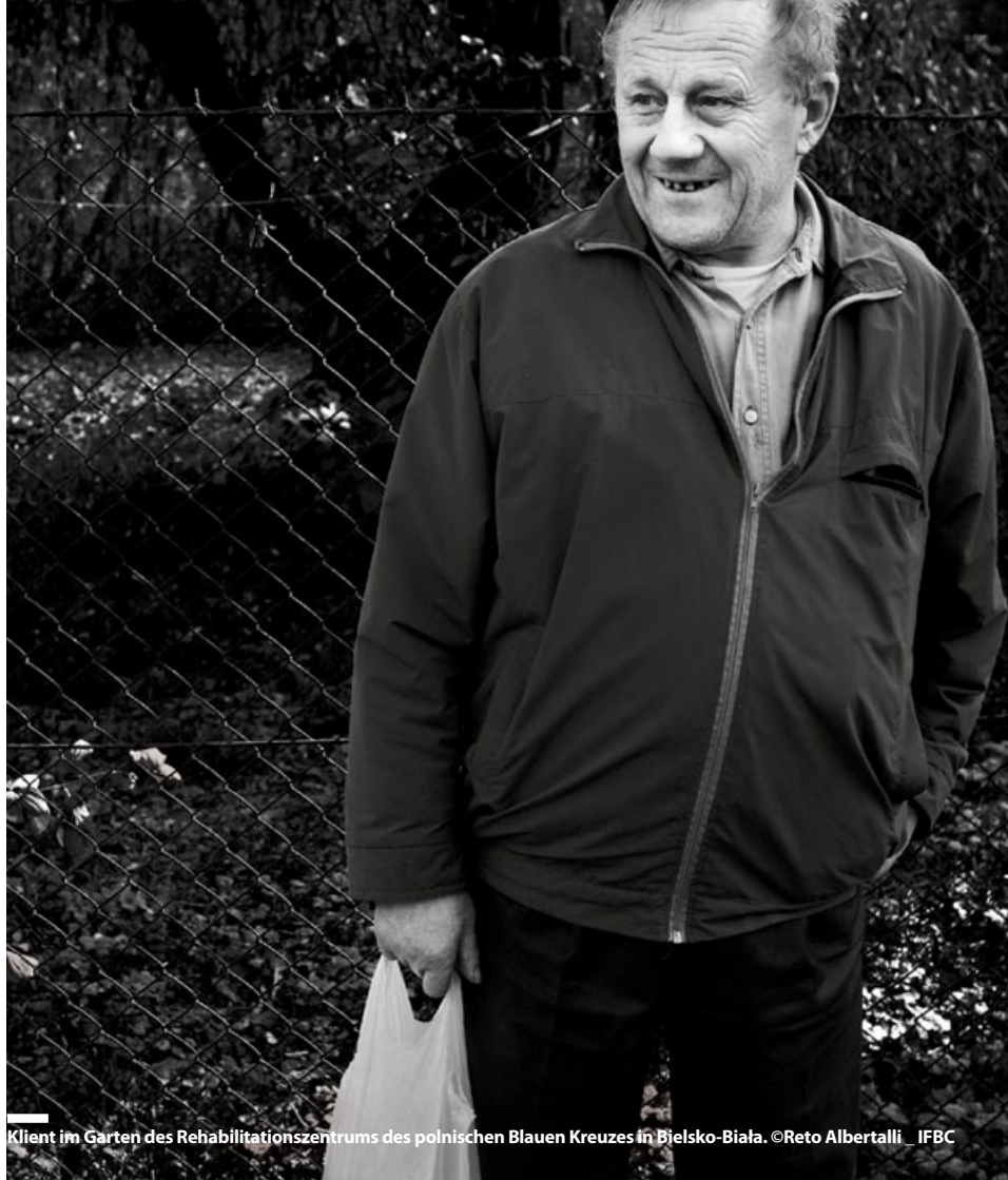
Klient im Garten des Rehabilitationszentrums des polnischen Blauen Kreuzes in Bielsko-Biala.

Die Revision erfolgte nach dem Schweizer Standard zur Eingeschränkten Revision. Danach ist die Revision so zu planen und durchzuführen, dass wesentliche Fehlaussagen in der Jahresrechnung erkannt werden. Im Rahmen der Revision ist die BDO AG auf keine Sachverhalte gestossen, aus denen sie schliessen müsste, dass die Jahresrechnung kein den tatsächlichen Verhältnissen entsprechendes Bild der Vermögens-, Finanz- und Ertragslage in Übereinstimmung mit Swiss GAAP FER vermittelt und nicht Gesetz und Statuten entspricht.