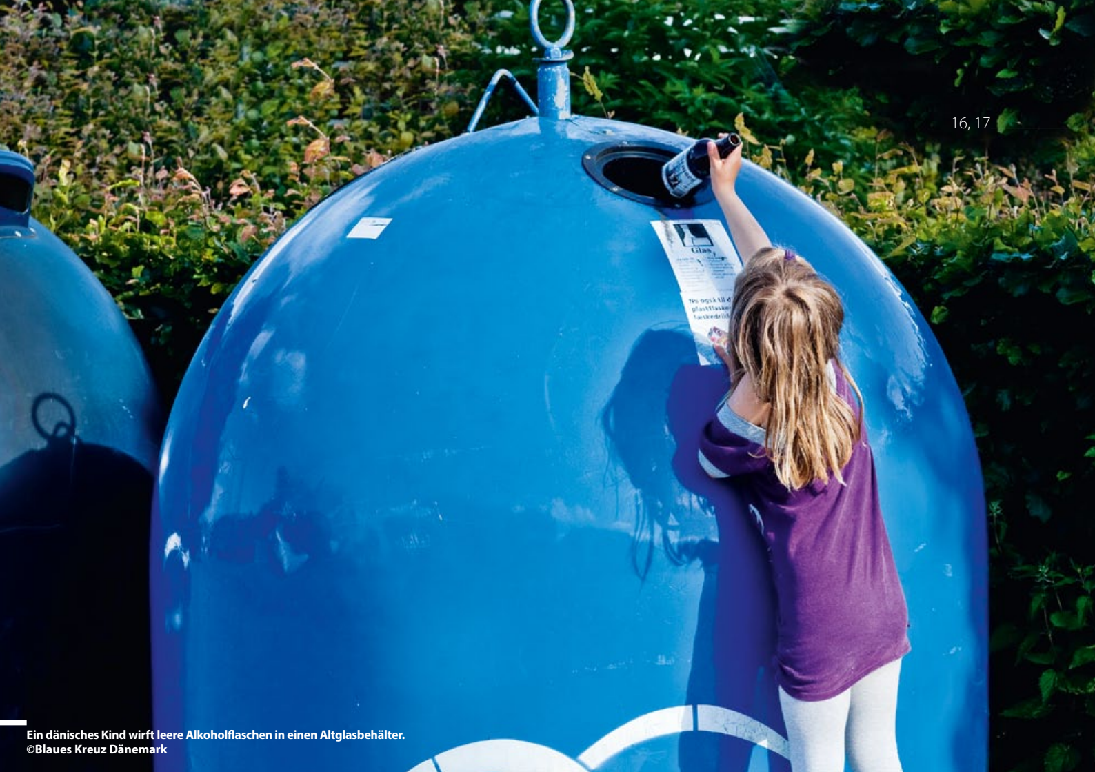
Ein dänisches Kind wirft leere Alkoholflaschen in einen Altglasbehälter.