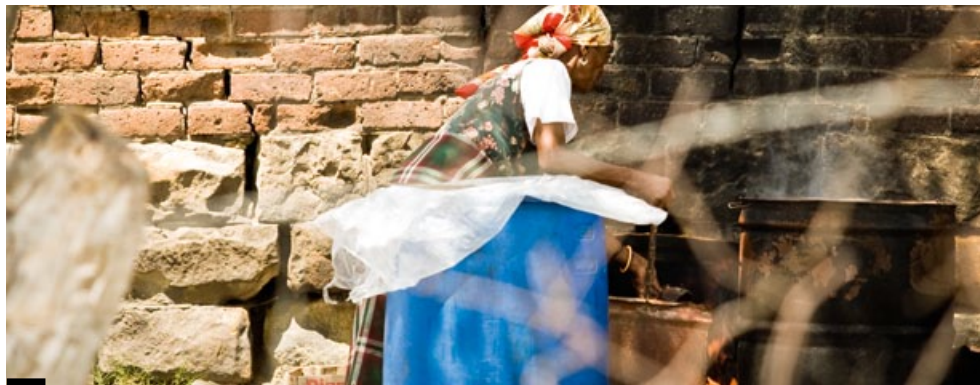
Heimproduktion von Alkohol in Lesotho.

«Wir sind stolz darauf, dass das Zentrum den ICDP-Ansatz erfolgreich in die aktuellen Behandlungsprogramme – bestehend