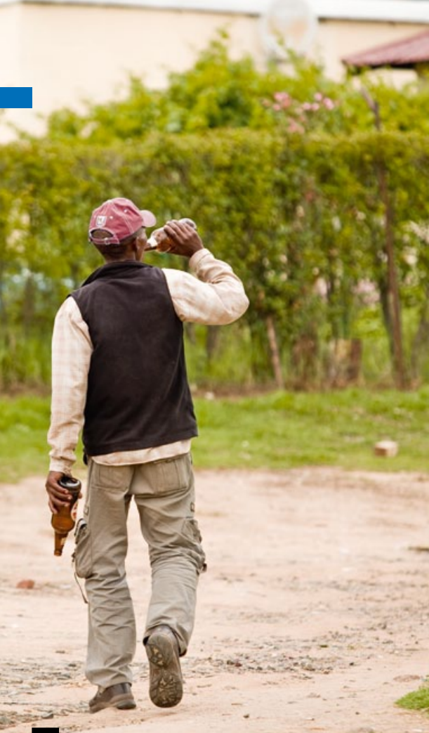
Alkoholmissbrauch ist weit verbreitet in Lesotho.