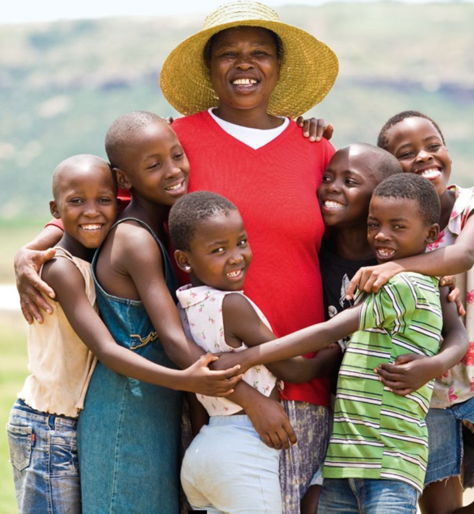
Blaues Kreuz in Lesotho: Präventionsarbeit mit Kindern.

aus Motivationstherapie, Einzel- und Familientherapie sowie Prävention – integrieren konnte. Selbstverständlich müssen wir noch einige Hürden überwinden, insbesondere betreffend der kulturellen Normen und Ansichten zur Kindeserziehung. Doch wir sind überzeugt, dass Kultur dynamisch ist und sich wandeln kann, und dass dank positiver Erfahrungen ICDP immer besser von der einheimischen Bevölkerung angenommen werden wird.